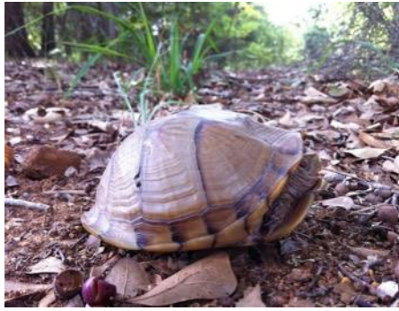
Terrapene carolina triunguis Leeft in open bossen, weilanden en drassige weiden.