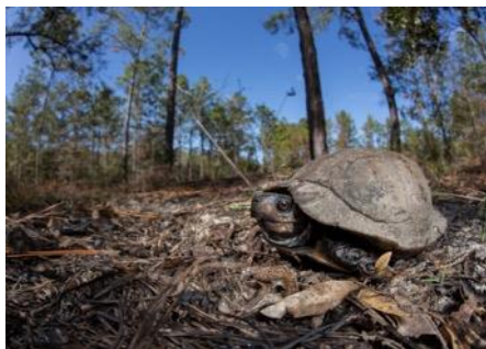
Terrapene carolina major

Wetlands, moerassen, geen naaldbossen, volwassen dieren ook op open velden.