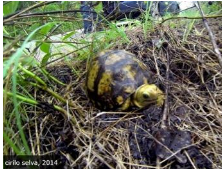
Terrapene carolina yucatana Alle doosschildpadden zijn dol op vochtigheid maar dit geldt vooral voor de Yucataanse doosschildpad die in de tropische bossen van het schiereiland Yucatan leeft. Ze worden zelden door mensen aangetroffen en worden vaak alleen gezien tijdens of na regen.