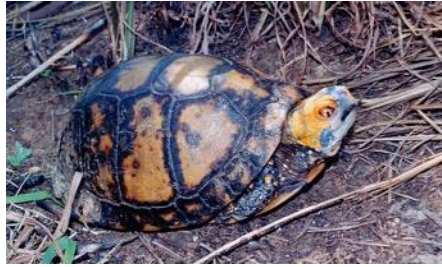
Terrapene carolina mexicana Leeft in gebieden met tropisch klimaat in vochtige bossen bij ondiepe regenwaterplassen.