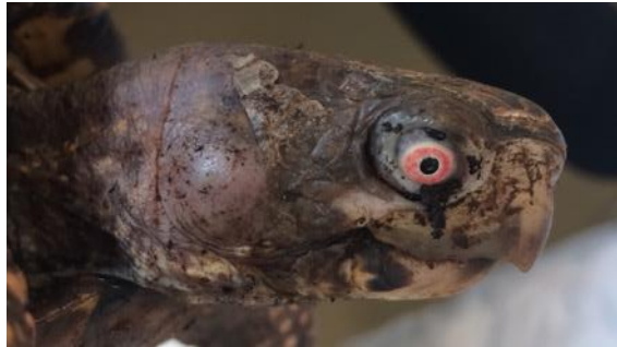
Terrapene carolina carolina man met oorontsteking

Dooschildpadden zijn gevoelig voor oorontstekingen, vaak het gevolg van een vitamine A-tekort, maar ook wel door vuil water. Een vitamine A-tekort kan worden vergezeld door dicht zittende opgezwollen oogleden en een luchtweginfectie met helder slijm uit de neus. Het dier wordt apathisch en zal zich terugtrekken. Mogelijk ook zijn er kraakgeluiden te horen en komt er schuim uit de bek. Neem direct contact op met een dierenarts die ervaring heeft met schildpadden.