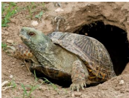
Terrapene ornata luteola Vergelijkbaar met Terrapene ornata ornata , maar meer westelijk en dus droger. Ze geven de voorkeur aan droge, open prairiegebieden, maar zijn ook gevonden in graslandgebieden waar er een overvloed aan yucca is rond grasland.