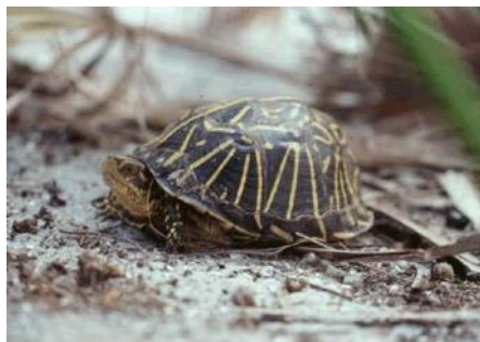
Terrapene carolina bauri

Velden, moerassige weiden, open bossen en oevers van rivieren en meren.