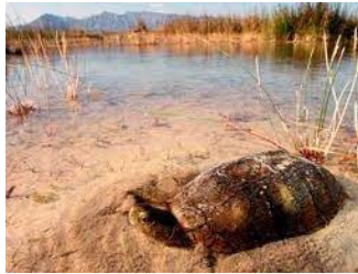
Terrapene coahuila Leeft in wetlands en heeft een beperkt verspreidingsgebied.