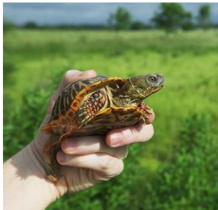
Terrapene ornata ornata Prairie en bos. Luchtvochtigheid 60%, in de natuur vaak ingegraven of in tunnels.