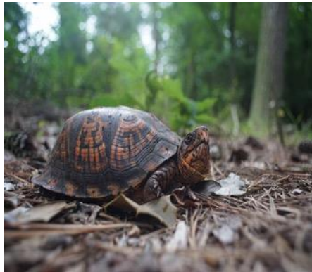
Terrapene carolina carolina

Velden, moerassige weiden, open bossen en oevers van rivieren en meren.